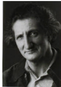
Guido Molinari artiste peintre