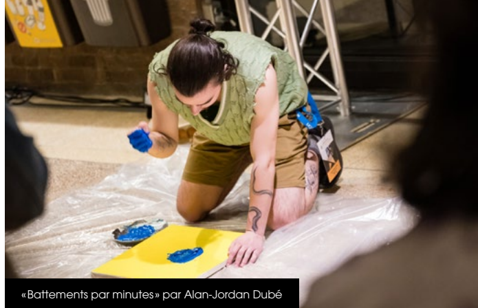
« Battements par minutes » par Alan-Jordan Dubé

LES ŒUVRES NE RESPECTANT PAS CES NORMES NE SERONT PAS EXPOSÉES.