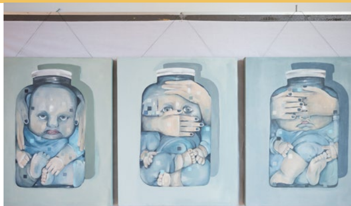
« Aquariums » par Kariné Emmeyan