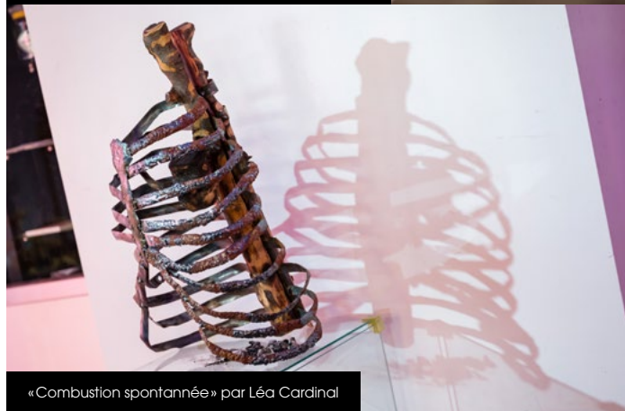
« Combustion spontanée » par Léa Cardinal