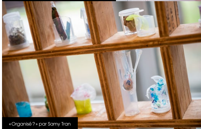
« Organisé ? » par Samy Tran